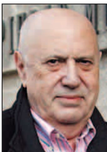
Xosé Luis Méndez Ferrín ESCRITOR

“O suplemento evoluiu cara a unha visión máis ampla do acontecer cultural”