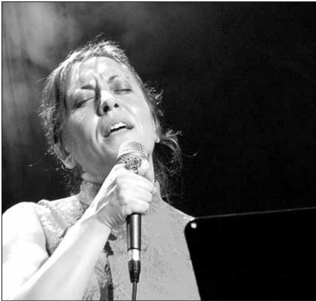
A cantante Uxía Senlle.

-Eu sabía da existencia desas vontades de facer unha festa da lusofonía. Xa existen proxectos deste tipo en Portugal, pero aquí, exercendo desde Galiza como anfitrións, nunca se fixera e eu tiña moitas ganas. Sabía que ía ter moi boa aceptación, e parecíame que había que propiciar o coñecemento doutras voces, máis aló dos nomes consagrados. Na primeira edición contamos con Chico César, un dos nomes máis importantes do pop de raíces africanas en Brasil. Naceu no Estado de Paraíba e ten un xeito moi pecu-