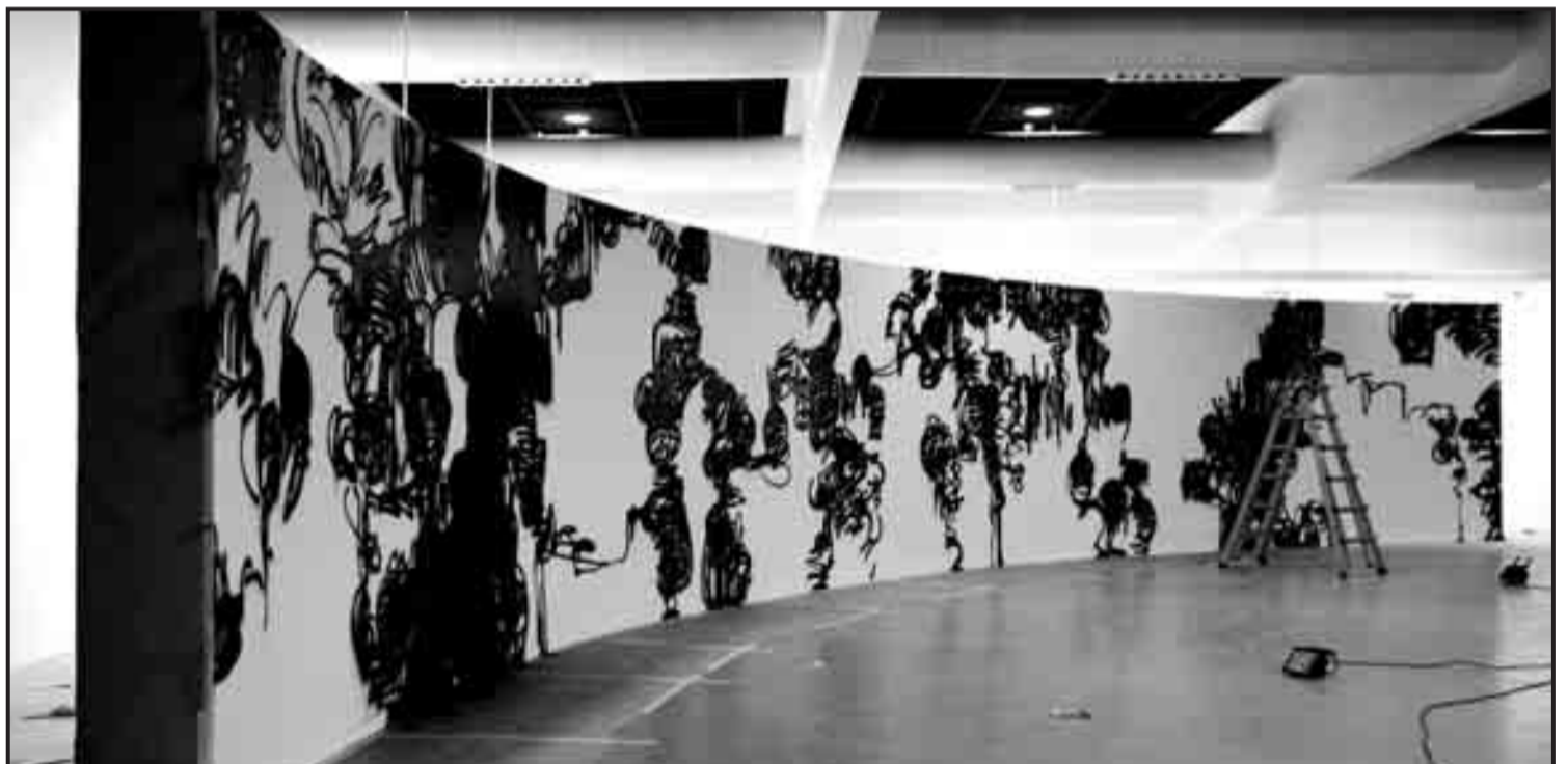
“Paredes”, de Carlos Maciá.

Que é o que fan os outros artistas que non se contan entre os mestres da orquestra sinfónica do primeiro teatro do mundo para realizar as súas obras? Acontece que ou xa colaboran con clientes priva-