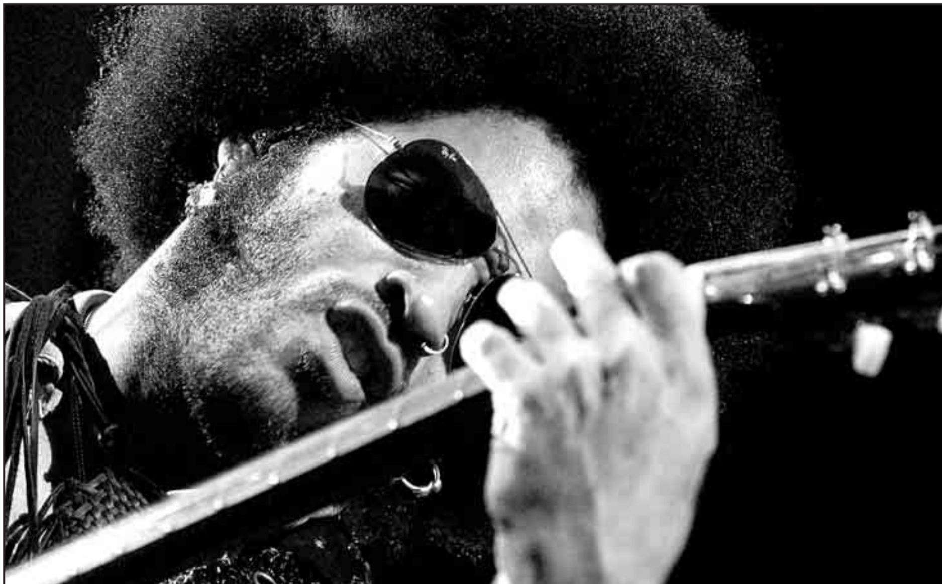
Lenny Kravitz, durante unha recente actuación.

a máis importante-, do rock americano na década dos noventa. "Are you gonna go my way", "Rock and roll is dead", "American Woman" ou "Fly away" forman parte imprescindíbel da banda sonora desa década, -tamén a industria discográfica non deixou daquela que fose doutro xeito-, e o seu rock descarnado, debedor da música dos sesenta e setenta: Led Zeppelin, The New York Dolls ou Jimi Hendrix, é hoxe unha referencia para as novas bandas que van chegando á escena rock mundial. De feito, é probábel que non puidese ser doutra maneira. O fillo dun produtor musical e televisivo e dunha coñecida actriz ao que lle chegou a cantar o "Happy Birthday" Duke Ellington de cativoño, axiña tentou abrirse camiño no mundo da música. Autoalcumouse Romeo Blue e deambulou polo pop e o funk, fortemente influenciado pola música de Prince, sen obter moito éxito. Despois de casar coa coñecida, na altura, actriz Lisa Bonet, de abandonar o pseudónimo, de asinar contrato cunha multinacional e de mudar totalmente o seu estilo cara ao rock, as cousas cambiaron. Segundo ten dito o propio artista, en aceptándose tal e como era, a música comezou a lle nacer con naturalidade.